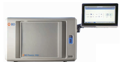
販売名：BD フェニックス M50 製造販売届出番号：07B1X00003000159

留意事項：「4」の薬剤耐性菌検出は、基質特異性拡張型β-ラクタマーゼ産生、メタロβ-ラクタマーゼ産生、AmpC産生等の薬剤耐性因子の有無の確認を行った場合に算定する